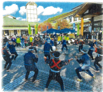
10月下旬 三和の里ふすま祭り