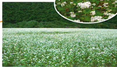
永井のそば栽培地 (そばの花) (M)