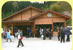
② 三和町ふれあい市場

休 (火曜日) 営 (4~9月 9:00~17:30 10~3月 9:00~17:00) 問 (97-3566) FAX (97-3567)