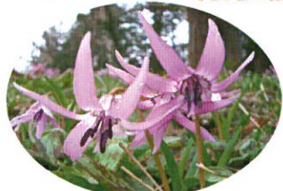
綿津海神社 (F) のカタクリ