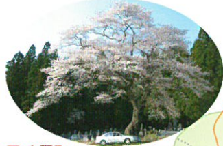
至:小野町 種まき桜 (H)