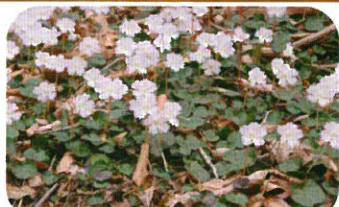
ガロ山 (L) のイワウチワ