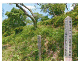
シダレグリ自生地 (D)