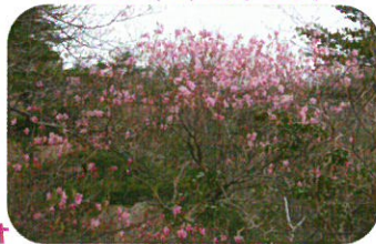
ガロ山 (L) のアカヤシオ