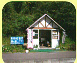
③ 柏の里 (柏もち)