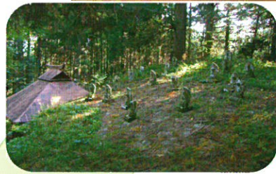
差塩良々堂三十三観音霊場 (十六羅漢) (K)