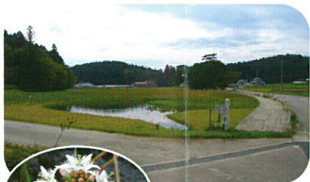
差塩湿原 (J) ミツガシワ