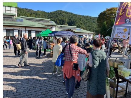
【物販ブースの様子】