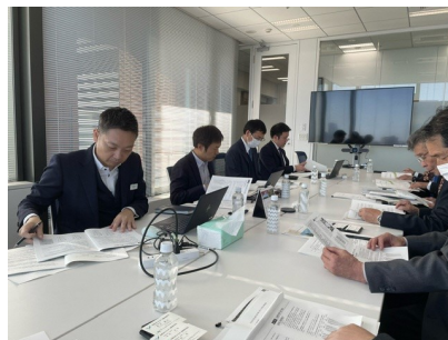
【意見交換会の様子】

今後、当協議会では、協定に基づきいわき三和風力発電事業を展開する事業者からの地域貢献策を含めて地域振興に努めていくとともに、地域振興を図るに際しての連携方策や可能性も検討・協議していく予定としています。