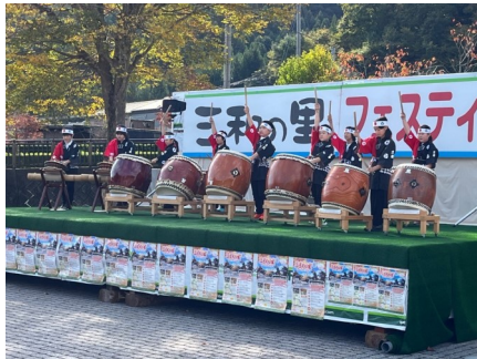
【ステージイベント：三和太鼓】

また、キッチンカーや福島牛の試食コーナー、屋内ゲートボール場での親子で遊べるコーナーの設置、三和小中学校校庭での職業体験ワークショップなどの新たな取り組みも行われる中、町内外から、前年を超えるたくさんの来場者が訪れました。